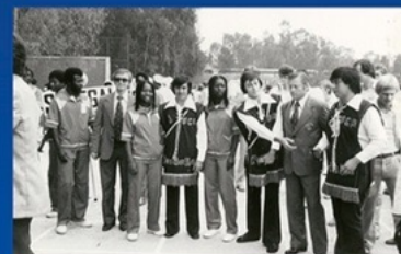
Москва 1979 год.

высокопрофессиональный коллектив преподавателей, созданы учебно-методические комплексы и учебные пособия. Им разработан курс оздоровительной физической культуры для студентов специальной медицинской группы.