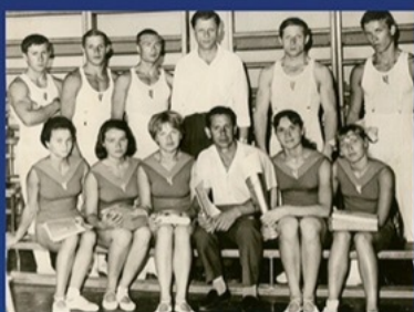
Команда по спортивной гимнастике ЧГПИ. 1967 год.

Открытие соревнований пройдет 23 ноября в 13:00 в школе Олимпийского резерва ЧТЗ по адресу: ул. Савина, 5. Вход свободный.